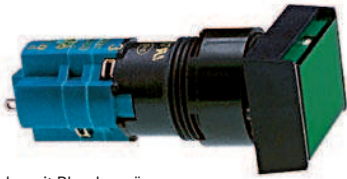
Abb.: mit Blende, grün